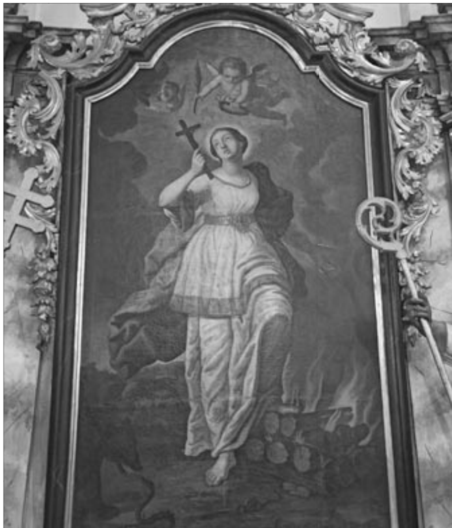
Svatá Tekla – boční oltář v Horce nad Moravou