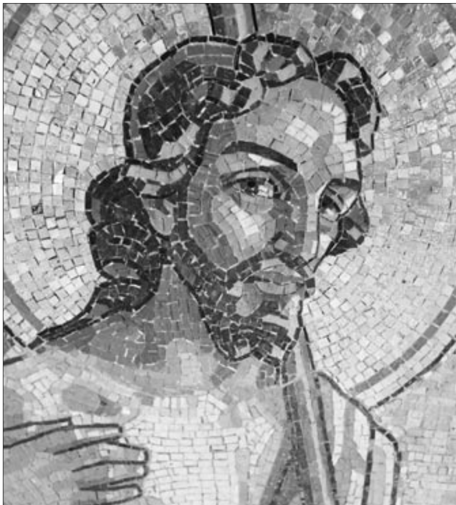
Svatý Jan Křtitel, detail oltářní mozaiky v Hejčíně