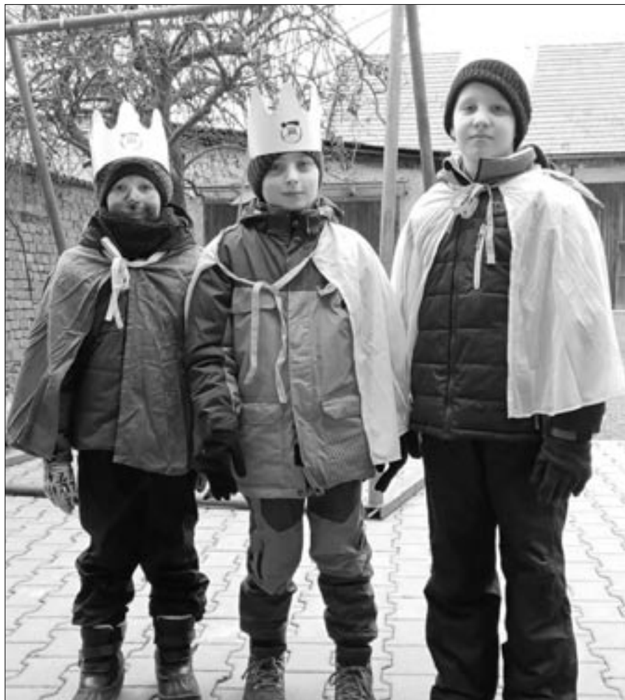
Tříkrálová sbírka 2022 v Horce nad Moravou