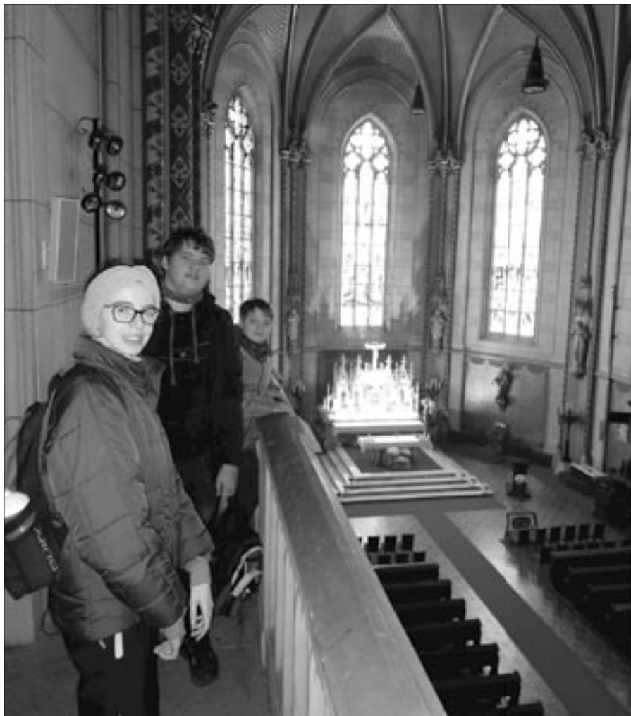
T-Club v olomoucké katedrále