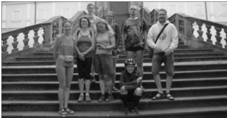
Hora Matky Boží u Králík