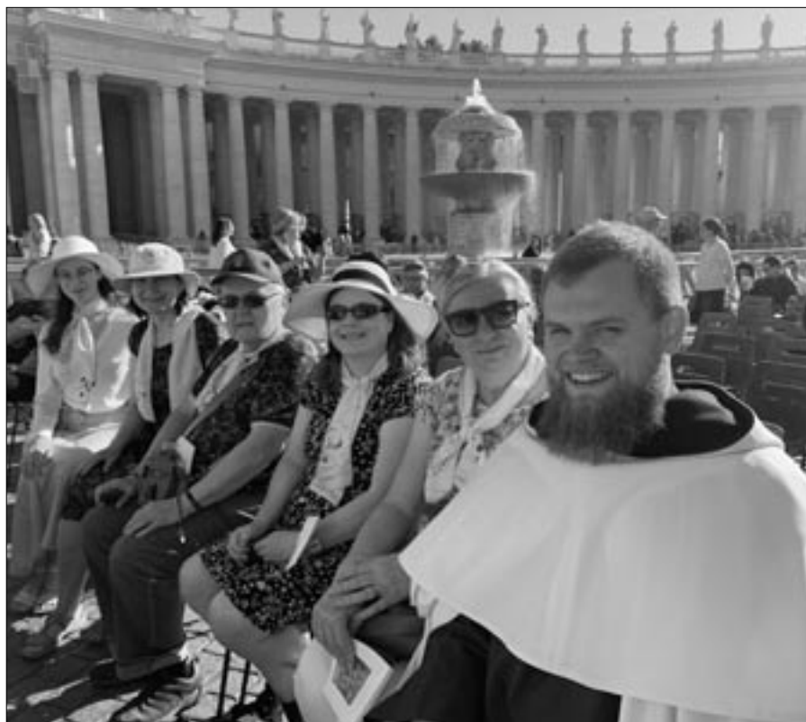
Společně s karmelskými terciáři z Česka, připraveni na slavení mše svaté na náměstí Sv. Petra

vytvořit jedno veliké společenství bratří a sester Karmelu, které se společně radovalo, že někdo z jeho středu byl svatořečen. Toto jsme také mohli slavit s celou církví, a to je nesmírně důležité, že totiž nejsme ve víře sami, ale žijeme ji ve společenství. A třetím a posledním bodem bylo pro mě setkání s bratřími a sestrami, které jsem poznal už dříve, a nové setkání napříč „celým světem“, která mi opět připomněla, že sice jsme z různých kontinentů a míst navzájem vzdálených a mluvíme různými jazyky, ale že srdce Karmelu a život pod ochranou škapulíře naší Matky Panny Marie je inspirující nejen pro řeholníky a řeholnice,