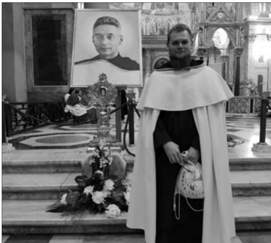
Před vigilií s ostatky bl .Tita Brandsmy

Celá mše svatá byla velmi krásná hloubkou slavení a krásnou liturgií, slavenou v radosti nad Boží velikostí, která se projevuje zde na zemi a kterou on sám, náš Pán, zve ke svatosti. Papež František opět zmínil, že ke svatosti jsme povoláni všichni. Byl jsem, pokud se to tak dá říci, „správně hrdý“ na to, že právě bl. Titus byl toho dne svatořečen a že kromě dalších devíti světců a světic je to právě on, který vydal svědectví o našem Pánu až do krajnosti tím, jak žil a pak i zemřel během 2. světové války v koncentračním táboře v Dachau.