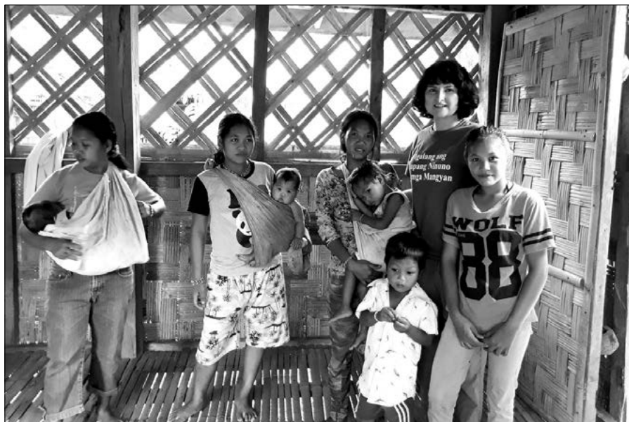
Po mši svatě v kapli