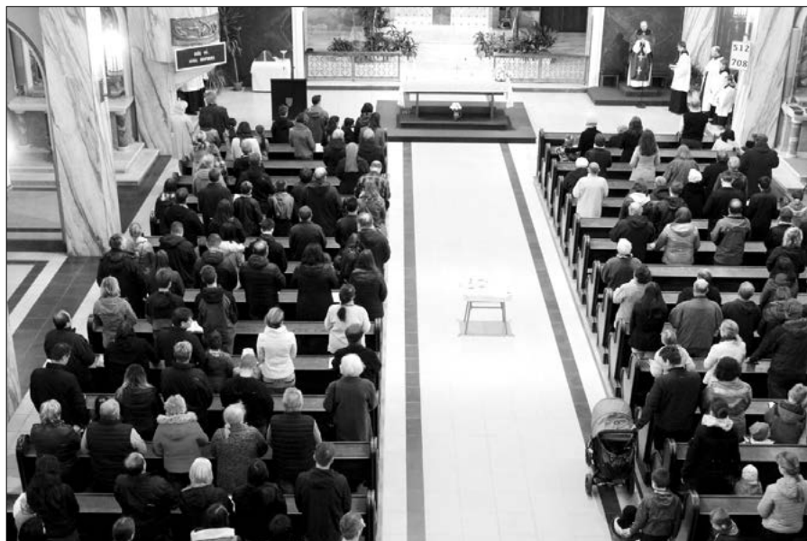
Po deseti minutách