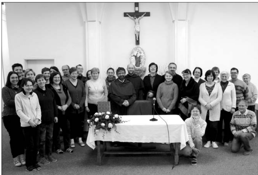
Společná fotografie většiny účastníků duchovní obnovy