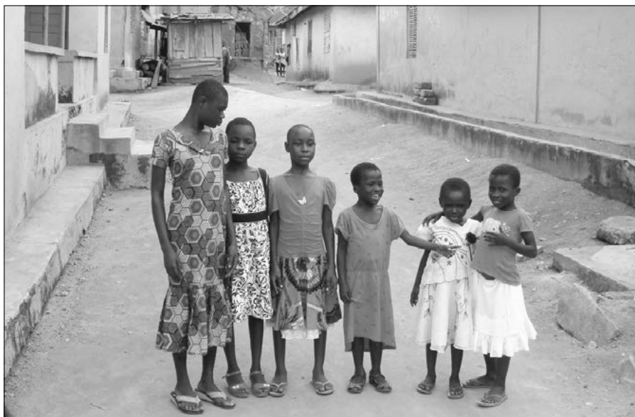
Děti z Adopce na dálku