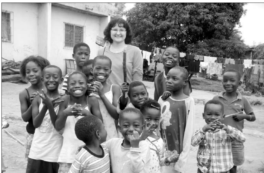
Děti z Tepy

Velkým povzbuzením pro mě bylo také vidět, jaký lidé mají vztah k Božímu slovu. Nejen to, že od dětství jsou schopni