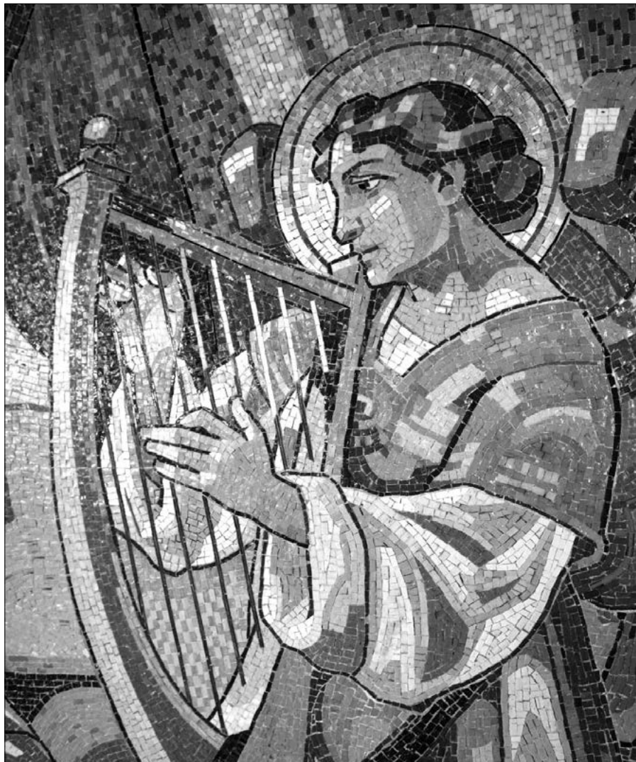
Anděl, detail oltární mozaiky v Hejčíně